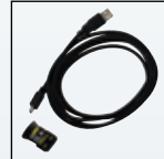
Kit di connettività IR