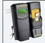
Compatibile con MicroDock II