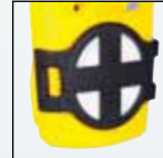
Kit di filtri supplementari