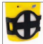
Kit di filtri supplementari