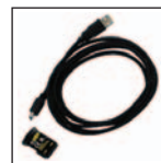
Kit di connettività IR