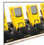
Caricabatterie da tavolo per cinque unità

Per un elenco completo degli accessori contattare BW Technologies.