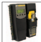
Compatibile con MicroDock II