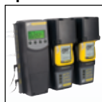
Compatibile con MicroDock II