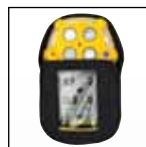
Fondina da trasporto