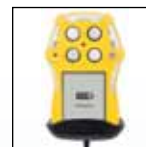
Supporto per veicoli

Per un elenco completo degli accessori contattare BW Technologies by Honeywell.